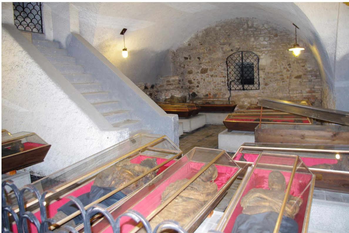
Obr. 2 Vnitřní prostory „katakomb“