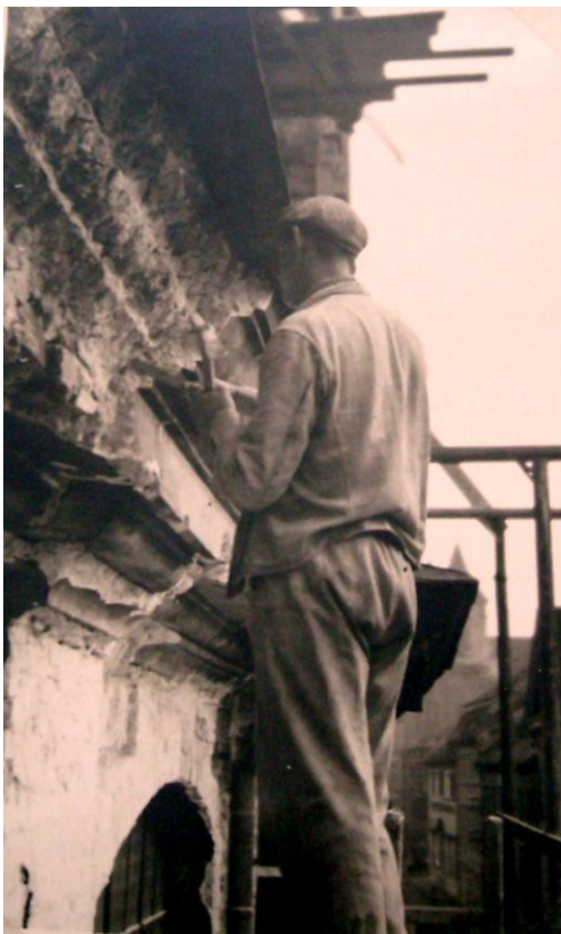
Obr. 5 Úpravy kostela v 30. letech 20. století