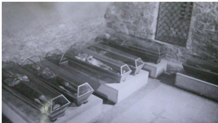
Obr. 6 Prostory „katakomb“ před rokem 1937