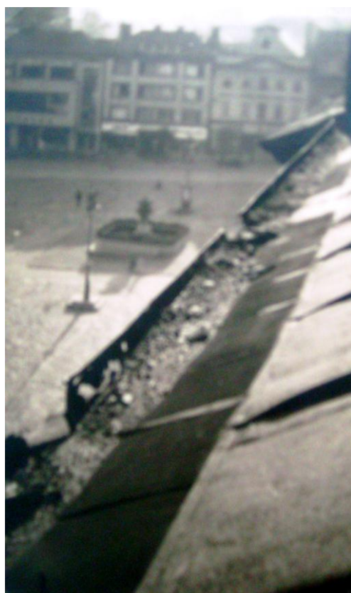
Obr. 7 Pohled na náměstí ze střechy kostela