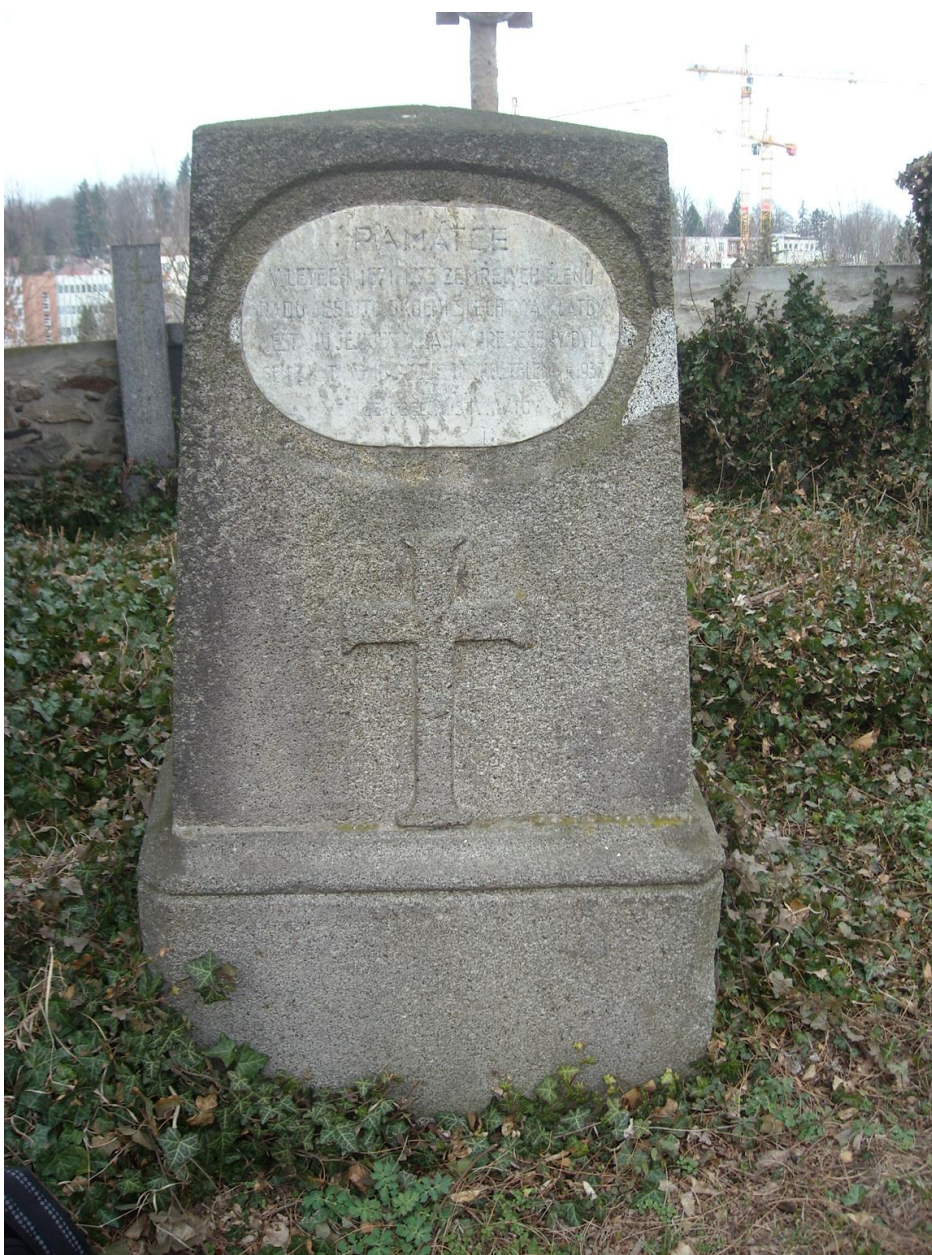
Obr. 8 Fotografie hrobu na klatovském hřbitově, kde jsou uloženy některé mumie z „katakomb“