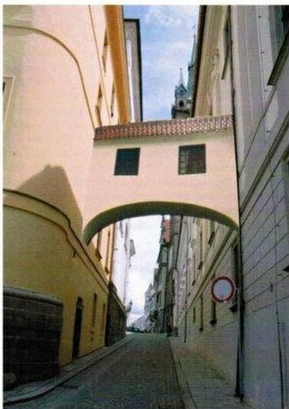
Obr. 2. Klatovy, dílčí průhled Balbínovou ulicí směrem k východu. Vizualizace jedné z pracovních variant návrhu prampouchu na jednoduchý barokní způsob. (Fotoarchiv Národního památkového ústavu, ú. o. p. v Plzni, snímek z roku 2012)

V souvislosti s přípravou nových prohlídkových okruhů byl předložen návrh na vybudování spojovacího mostku napříč Balbínovou ulicí, mezi budovou jezuitské koleje a kostelem. Vzhled mostku, jehož existenci na způsob prampouchu (dvou prampouchů?) nasvědčují archivní prameny, 4 nebylo možné odvodit z žádných historických vyobrazení nebo popisů koleje, ani z nálezové situace. Nejdříve se uvažovalo o historizujícím řešení povšechnou nápodobou prampouchu v období baroka (obr. 2).