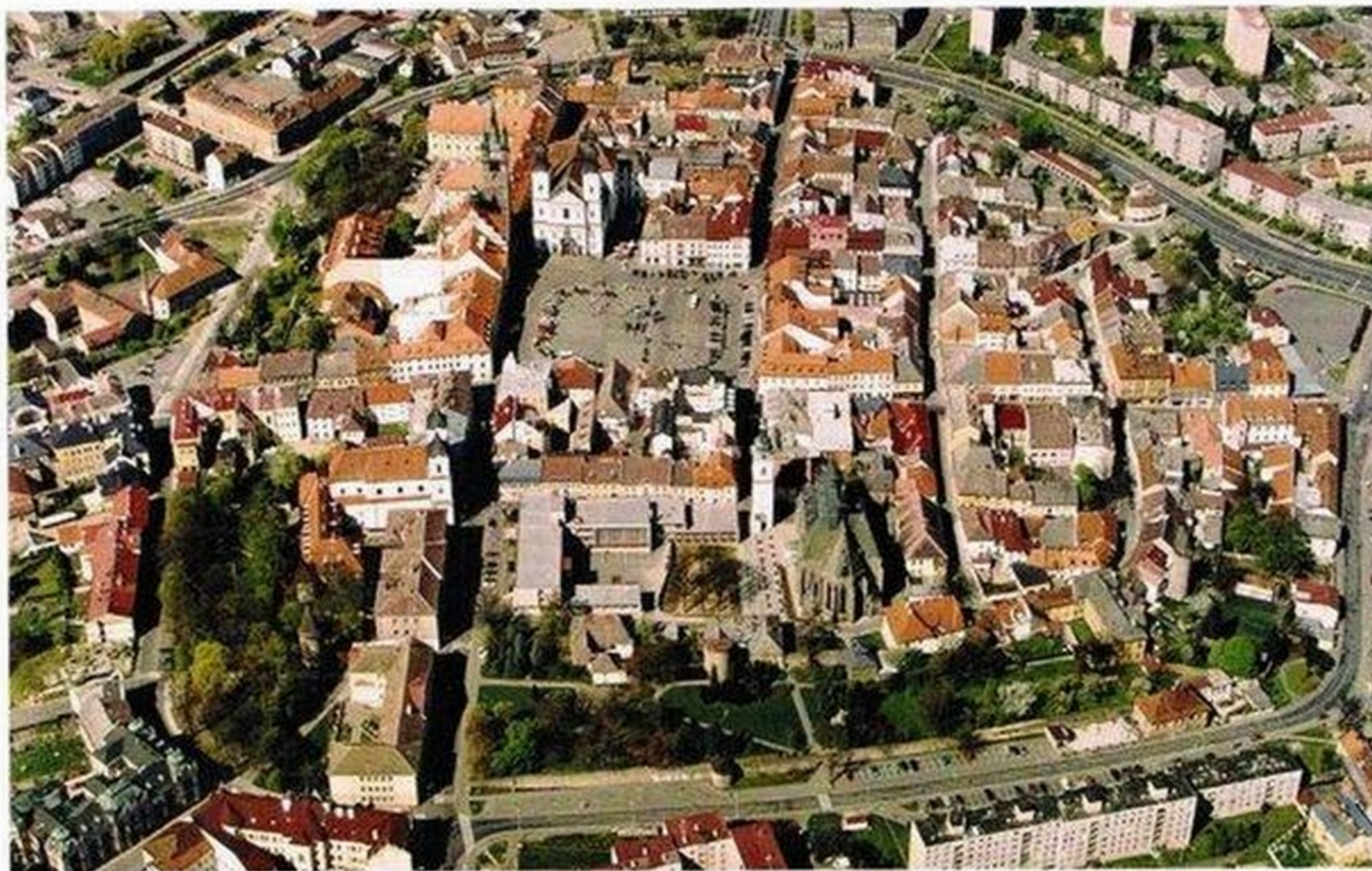
Obr. 1. Klatovy, letecký pohled na historické jádro města. (Fotoarchiv Národního památkového ústavu, ú. o. p. v Plzni, snímek z roku 2006)